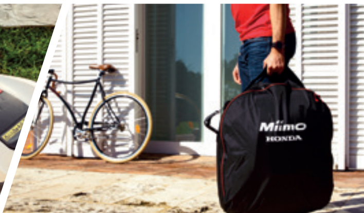
Sacca per il trasporto di Miimo