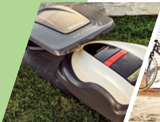
Copertura stazione Miimo

E' disponibile un'ampia gamma di accessori per Miimo che lo aiutano a rendere la tua vita più facile.